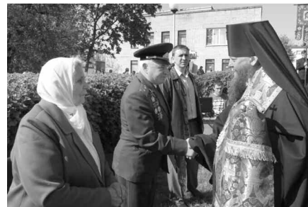
Затем была совершена заупокойная лития о почивших воинах.

Поздравив всех с этим великим днем, Архиерей отметил: «Наши предки не падали духом, ибо радели не о личных опасностях и выгодах, а о священном долге пред Богом и Отечеством. Потому и победили. «Бог не в силе, а в правде» — помните эти слова святого благоверного князя Александра Невского? С правдой Божией не страшен враг. Ибо правда Божия всегда побеждает».