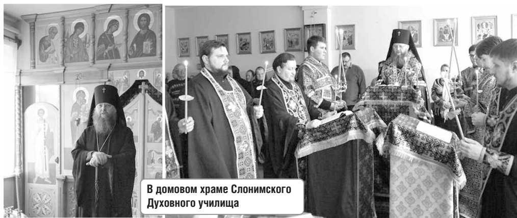
В домовом храме Слонимского Духовного училища