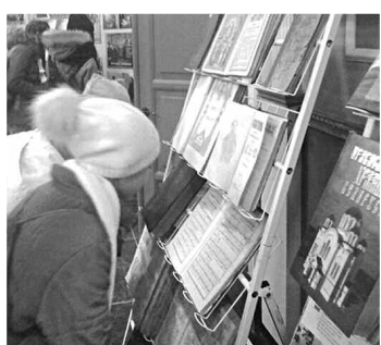
На выставке редкой старопечатной книги в г. Слониме