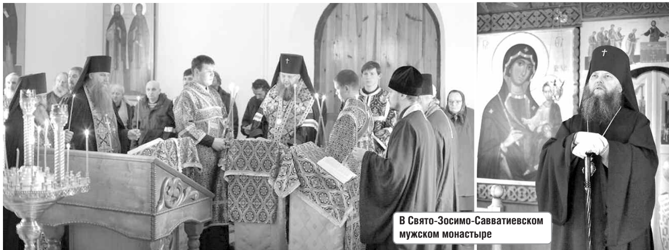
В Свято-Зосимо-Савватиевском мужском монастыре

В первые четыре дня Великого поста во всех храмах Православной Церкви поется и читается по частям Великий покаянный канон преподобного Андрея Критского. Это как исходный тон, на который должна настроиться в посту каждая душа христианская.