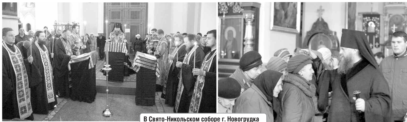
В Свято-Никольском соборе г. Новогрудка