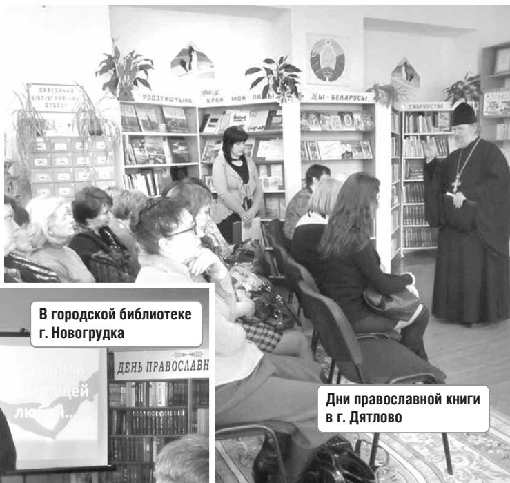
В городской библиотеке г. Новогрудка

В городах и весях прошли творческие вечера и встречи, были организованы выставки редких православных рукописных и старопечатных книг, а также передача православной литературы в городские и районные библиотеки, интернаты, детские дома и дома престарелых, места заключения.