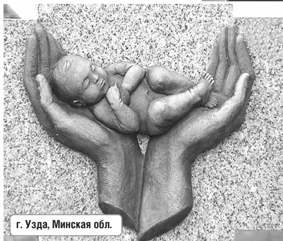
г. Узда, Минская обл.