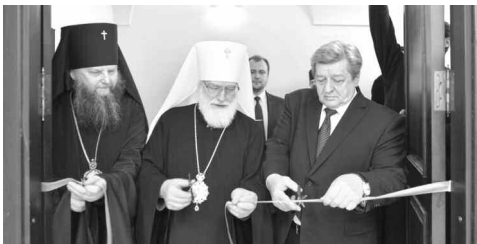
Пресс-служба Новогрудской епархии

После праздничного концерта, подготовленного мужским семинарским хором, состоялось открытие мемориальной аудитории, посвященной профессору Д.П. Огицкому (1908–1994), который в конце 1940-х и начале 1960-х годов преподавал в Минской Духовной Семинарии.