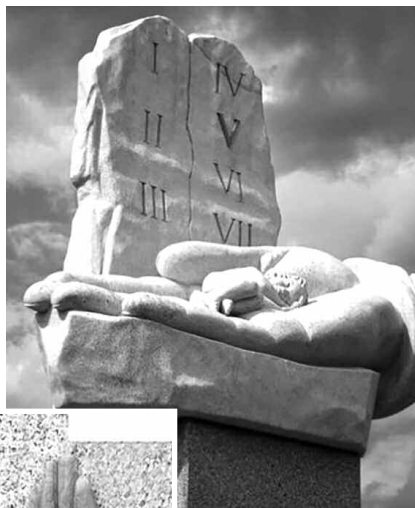
Памятник нерожденным детям в Польше

...Потеряв близкого человека и предав его земле, мы хотя бы имеем возможность прийти к нему на могилку, помолиться, поплакать, принести цветы. Но у миллионов неродившихся, убитых своими